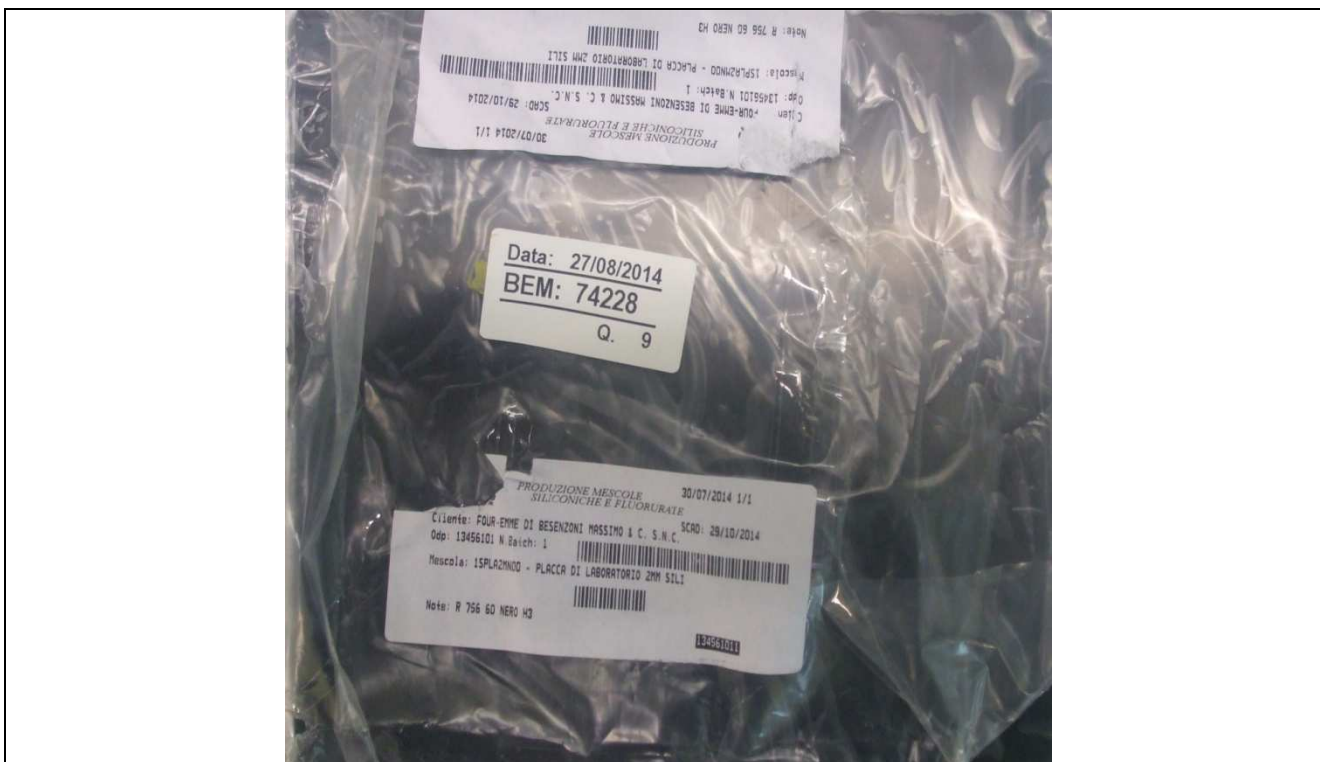
Foto prima della prova / Image before test